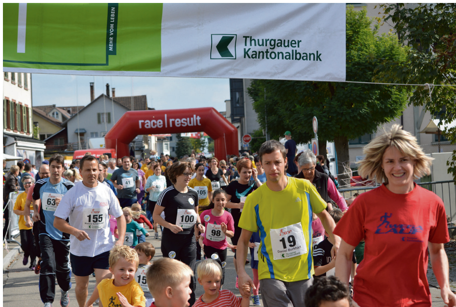
Der traditionsreiche Sportanlass für sämtliche Altersklassen im Zentrum Weinfeldens.

Der WEGA-Lauf 2016 steht in den Startblöcken.