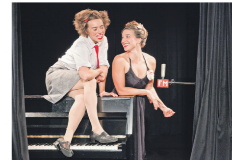
22. September: Luna-tic