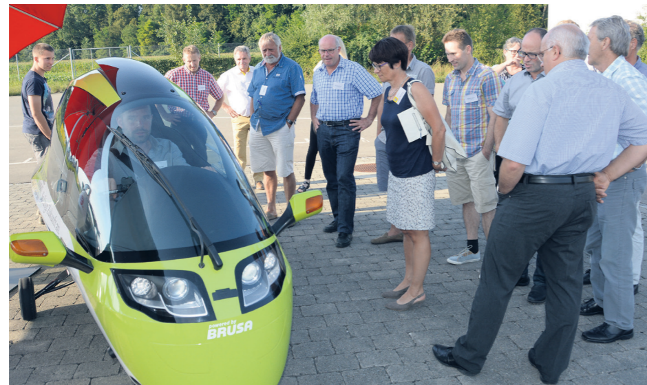
Die Gäste aus der Politik lassen sich den «Zerotracer» vorführen.