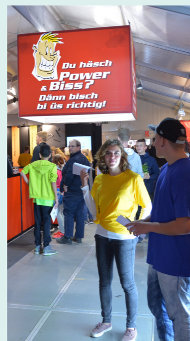
Informationsmöglichkeiten über alle Branchen an der Berufsmesse Thurgau