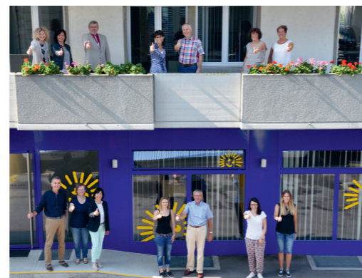
Seit 27 Jahren und besonders 2016 trotz Marktstagnation erfolgreich: das Team von Fleischmann Immobilien.