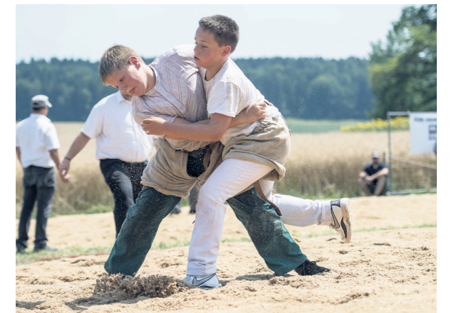
Wifelder Buremarkt – mit Stubete und Schnupperschwingen am Samstag, 03. Sept. 2016, Marktplatz Weinfelden

markt-Wurst gekauft, ein Glesli feinen Wein dazu getrunken und mit dem einen oder anderen kleinen Hüftschwung zur Musik die friedlichen Kontrahenten angefeuert!