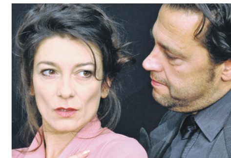
24. Oktober: «Brennende Geduld»

lich das Schauspiel des Theaters Kanton Zürich. Es wird eine spannende Bühnenreise!