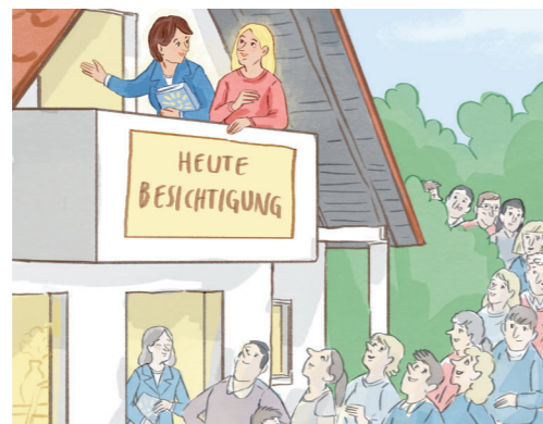
Leicht überspitzt dargestellte Szene anlässlich einer Hausbesichtigung – trotzdem: Die Nachfrage ist gross!

«Jetzt brauchen wir nach den grossen Verkaufs-ab-schlüssen unbedingt wieder neue Mandate, es wäre