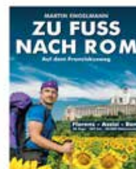
SONDERVORSTELLUNG MULTIVISION: ZU FUSS NACH ROM AM 27. FEBRUAR 2023