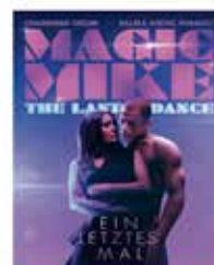
LADIES NIGHT & APÉRO MAGIC MIKE'S LAST DANCE AM 07. FEBRUAR 2023