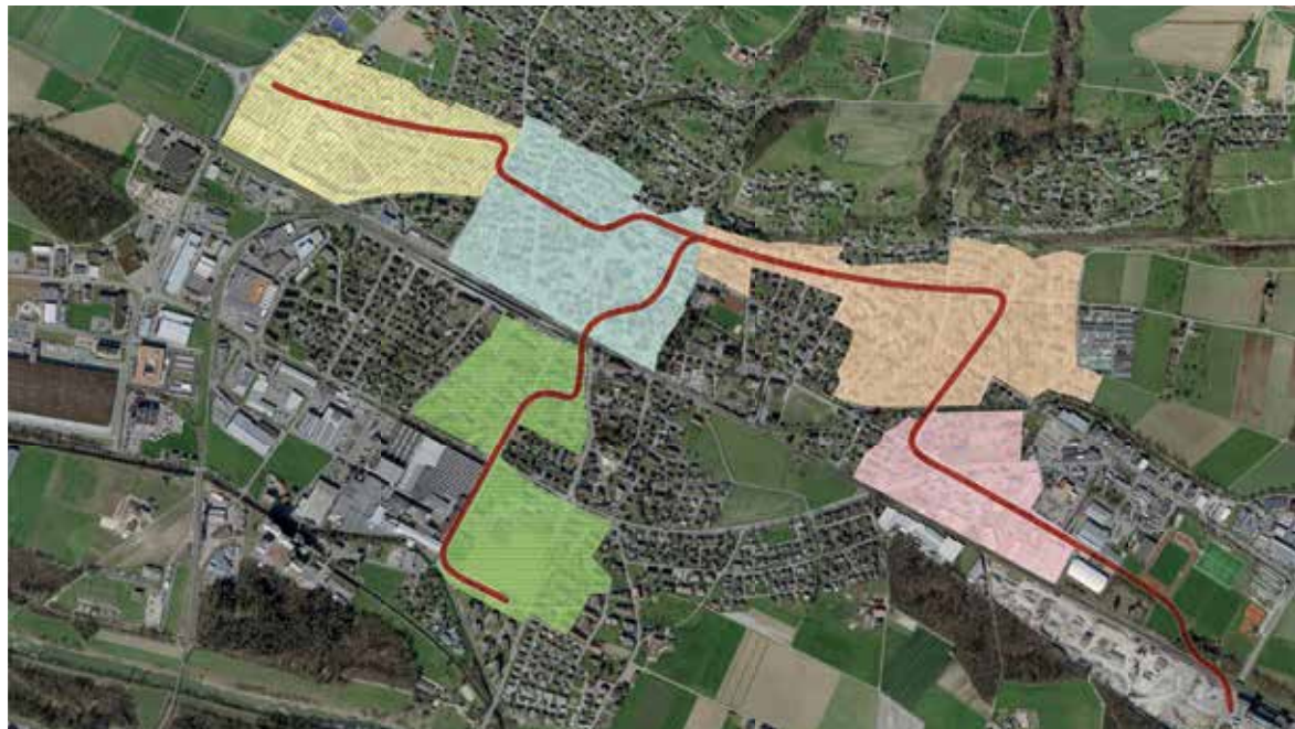
Geplantes Erschliessungsgebiet von «Wärme Weinfeldern»

Die Technische Betriebe Weinfeldern AG (TBW) baut ein neues Fernwärmenetz in Weinfeldern. Nach 2½-jähriger Planungszeit wurden nun dieses Jahr die ersten Bauarbeiten gestartet. Bis 2035 wird die TBW rund 23 Mio. Franken über mehrere Bauetappen für dieses Projekt investieren. Dabei geht die TBW von einer Wärmebereitstellung von rund 50% des gesamten Bedarfes der Stadt Weinfeldern im Jahr 2050 aus