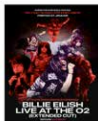
SONDERVORSTELLUNG BILLIE EILISH: LIVE AT THE O2 (EXTENDED CUT) AM 27. JANUAR 2023