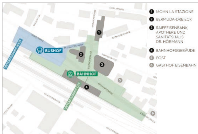
Betrachtungsbereich für Begegnungsräume am Bushof sowie auf der Nordseite des Bahnhofes Weinfelden

Sicherheit für alle Verkehrsteilnehmenden geschaffen werden. So erhalten die Postautos einen eigenen Haltebereich mit Überdachung, auch um den Komfort für die Fahrgäste zu erhöhen. Der Raum vor den bestehenden Personenunterführungen West wird mittels Bepflanzungen und Sitzmöglichkeiten als Umsteigeort deutlich wahrnehmbarer.