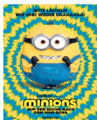
CH-PREMIERE AB 30. JUNI 2022 MINIONS AUF DER SUCHE NACH DEM MINI-BOSS