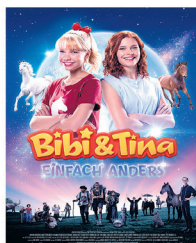
CH-VORPREMIERE AM 16. & 17. JULI 2022 COOP FAMILY BIBI & TINA - EINFACH ANDERS