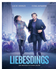
CH-PREMIERE AM 07. JULI 2022 LADIES NIGHT & APÉRO LIEBESDINGS