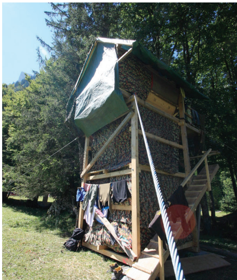
Ein klassisches Lagercamp einer Jungwachtgruppe

Infos zur Anmeldung und Kontaktpersonen bei Fragen sind unter www.jungwacht-weinfelden.ch/sola/ aufgeschaltet. Die Jungwacht Weinfelden freut sich eine gemeinsame, unvergessliche Zeit zu erleben.