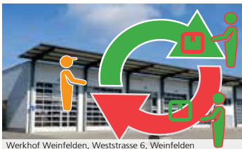
Werkhof Weinfelden, Weststrasse 6, Weinfelden

Bringzeit Freitag, 10. Juni 2022 | 17 – 19 Uhr Es werden nur intakte und gereinigte Sachen entgegengenommen! Holzzeit Samstag, 11. Juni 2022 | 10 – 11 Uhr Nehmen Sie mit was Ihnen gefällt!