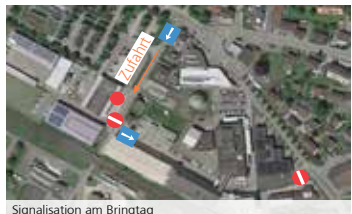
Signalisation am Bringtag

• Werkhof Weinfelden, Weststrasse 6, Weinfelden