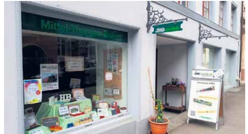
Das MThB-Lädenli an der Frauenfelderstrasse 9

Das neue Fahrtenprogramm für die Saison 2022 ist da! Informieren Sie sich auf der Website. Bei der Kesselrevision der Dampflok sind wir im Fahrplan. Der Verein Historische Mittel-Thurgau-Bahn bedankt sich bei allen bisherigen Sponsoren ganz herzlich und ruft gleichzeitig zu weiteren Spenden auf, da das Ziel von 110'000 Franken noch nicht ganz erreicht ist.