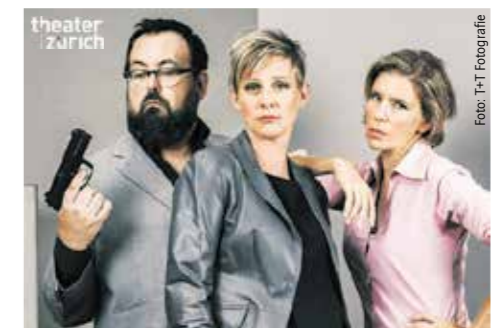
11. Nov.: «Central Park West» von Woody Allen

erarbeitet. Bitte beachten Sie, dass bei den Vorstellungen Maskenpflicht gilt. Das Schutzkonzept sowie weitere Informationen zum Programm findet sich demnächst unter www.tkweinfelden.ch .