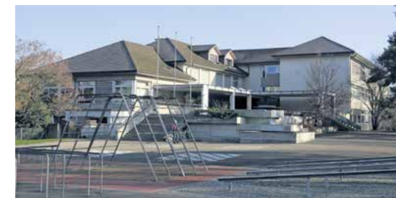
Kurz vor dem Baubeginn 2020

Zwischen Giessenweg und Deucherstrasse ist im Moment das neue Martin-Haffter-Schulhaus im Bau. Damit erleben ältere Weinfelder in der baulichen Entwicklung etwas, das uns eigentlich selten begegnet: Ein grosses öffentliches Gebäude, dessen Neubau und Einweihung wir noch miterlebt haben, wird ersetzt und anschliessend abgebrochen. Das ist ein guter Zeitpunkt zu erkennen, dass auch zu Geschichte wird, woran wir uns selbst erinnern.