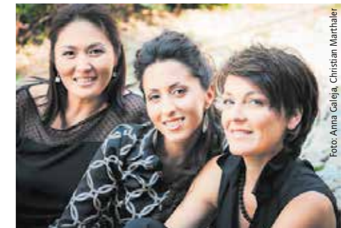
1. Nov.: Norea Trio

Damit wir gesund und sicher Kultur geniessen können, hat Theater Konzerte Weinfelden ein Schutzkonzept