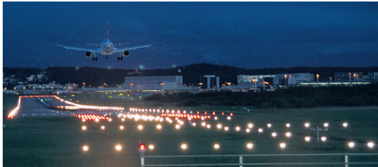
Die Spezialleuchten der Weinfelder Firma im Flughafen Zürich