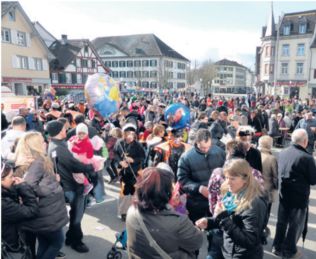
Anlässlich des Fasnachtsumzuges erfreut sich das Weinfelder Zentrum eines regen Besucherstromes.