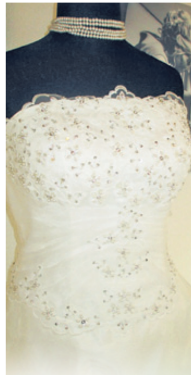
Werbung, die erstaunlich weite Kreise zog

Nach dem Fest legte ich mein Traumkleid samt Zubehör in einen Schrank. Als sich im Familien- und Freundeskreis die Hochzeiten häuften, kamen weitere festliche Kleider dazu, und so ist langsam die Idee einer eigenen Boutique gereift“, sagt Simone Kapl.