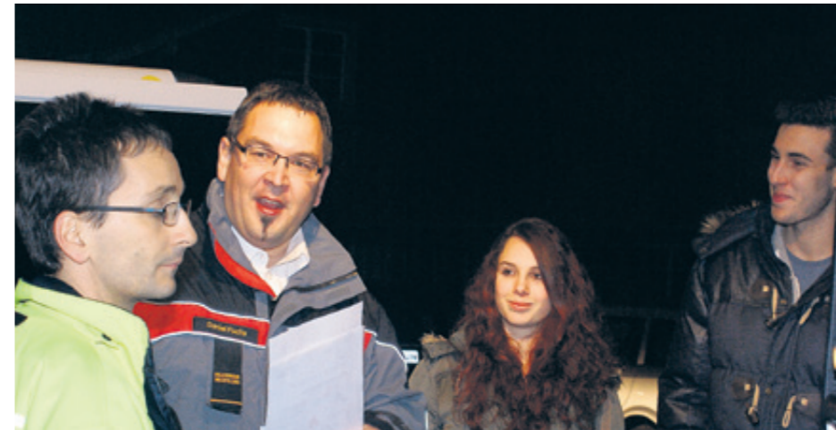
Interessierte und hoffentlich zukünftige Feuerwehrleute

Feuerwehr Weinfelden: Informationsabend für Interessierte