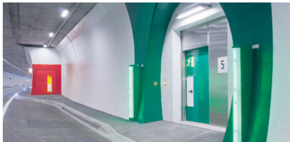
Notfall- und SOS-Leuchten sowie Anzeigen für Fluchtwege in Tunnels stammen aus Weinfelden

gentobler Spezialleuchten AG seit 5 Jahren eigenständig zu führen. In den wenigen Jahren hat er die Firma ausgebaut, so dass sie viele Aufträge von renommierten Firmen und Gesellschaften erhalten hat. Wer zum Beispiel vom Flughafen Zürich-Kloten abfliegt oder dort an-