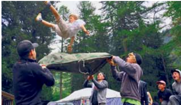
Spezialeinheit «S.O.P.» beim Training.

Die Jungwacht Weinfelden verbrachte ihr zweiwöchiges Sommerlager in Oberwald VS. Die mehr als 50 Jungs und ihre 20 Leiter halfen der Spezialeinheit «S.O.P.» die Falschgeldbande «Ten Bucks» zu stoppen.