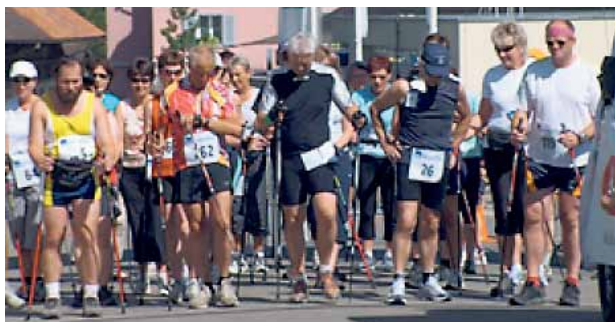
Vom Gelegenheitsjogger bis zum Top-Läufer kurz vor dem Start.

Weitere Auskünfte erteilt: 052 763 18 94, felix.schenk@bluewin.ch , oder www.runfit-thurgau.ch .