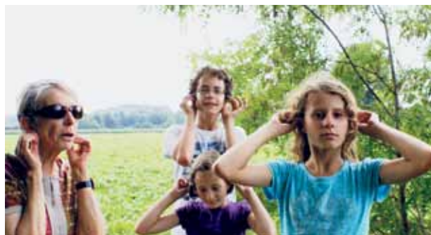
Spielerische Übungen die allen Spass machen

Ein wenig abseits von Weinfelden, aber gut erreichbar, befindet sich der Gripspfad von Weinfelden, westlich der Umfahrung, im Wäldchen hinter dem Käseerzeugungslager «Tilsiter». Der unübersehbare Wegweiser «Gripspfad» weckte in mir schon lange den «Gwunder», was wohl dahinter stecken möge. Sind da Posten aufgestellt mit akrobatischen Rechnungsaufgaben, sprachlichen Spitzfindigkeiten oder schwer lösbaren Rätsel? Oder einfach Gedächtnisübungen für Senioren? Weit gefehlt! Der Gripspfad lädt alle zu einem Rundgang ein, in dem auf spielerische Weise das Gehirn bewegt wird. Die Übungen sind äusserst angenehm, obwohl – wie geschrieben steht – sie auf neuesten Erkenntnissen der Gehirnforschung basieren. Als ich einer Schauspielerin davon erzählte, verriet sie mir, dass sie dieselben oder ähnliche Übungen täglich praktiziere. Also mutig drauf los! Mit Grosskindern, einem Nachbarskind und meiner Frau haben wir uns auf den Weg zum Gripspfad