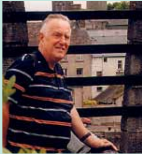
Alu Walk, Weinfelden

Ich finde den Weinfelder Anzeiger interessant. Ich habe mich schon mehrmals darüber auch mit Gästen unterhalten. Die Zeitung ist schön strukturiert und kompakt. Es ist auch ein Vorteil, dass es sich um eine lokale Zeitung handelt. Ich lese sie selber immer gerne, die ganze Zeitung. Sie gefällt mir.