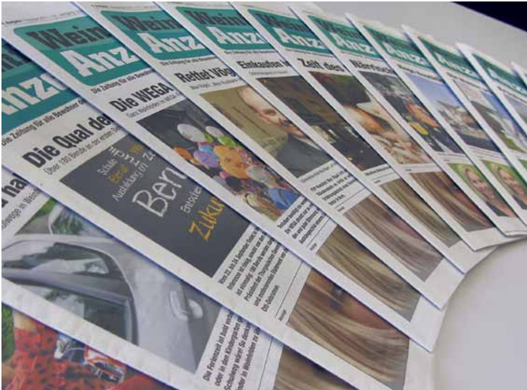
Ein Jahr im Dienste unseres Lebensraumes Weinfelden und Umgebung.