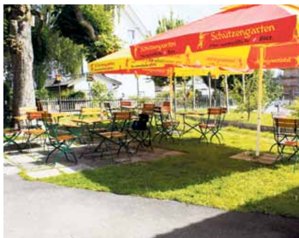
Zum Restaurant gehört im Übrigen auch ein Garten, in dem man sommerliche Abende besonders geniessen kann.

Der Geheimtipp an der Frauenfelderstrasse 57 in Weinfelden ist von Dienstag bis Samstag von 09.00 – 24.00 Uhr geöffnet, Sonntag und Montag ist Ruhetag.