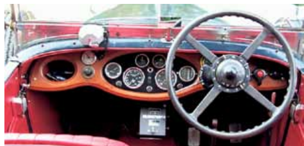
Massivholz und für die damalige Zeit absolut Hightech.

Einsendeschluss ist der 29. Juni 2011. Der/die Gewinner/in wird durch das Los ermittelt. Der Rechtsweg ist ausgeschlossen.