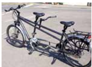
Ein Flyer-Tandem lädt zu einer Probefahrt ein.

Es gibt ganz verschiedene Typen mit unterschiedlicher Leistung, solche mit einer Geschwindigkeit bis zu 25 km