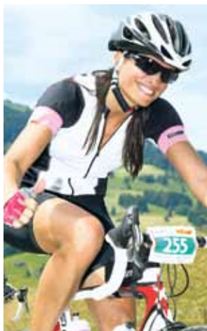
Gabriela Sabatini war schon dabei.

Bereits zum 12. Mal wird die Säntis Classic, das Radsportvergnügen für Vereine und Einzelfahrer, mit Start und Ziel in Weinfelden, durchgeführt. Die beliebte Classic-Tour führt durch eine herrliche Landschaft mit Höhepunkt Schwägälp auf 1350 müM. Viele Prominente, wie Beat Breu, Gabriela Sabatini und viele mehr, waren schon am Start und absolvierten diesen velosportiven Anlass der Superklasse von Wein-